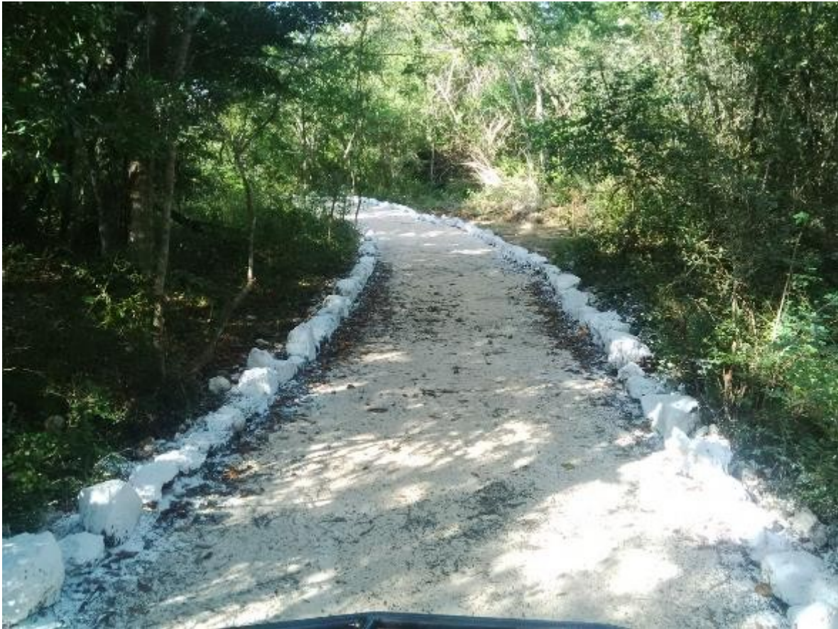
Fig. 5 sendero interpretativo terminado, servirá también como ruta de observación para el turismo de naturaleza.