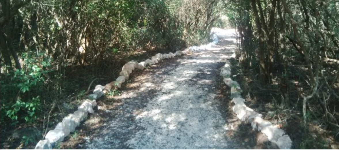
Fig. 6 sendero interpretativo dentro del sotobosque, ideal para la observación de aves.