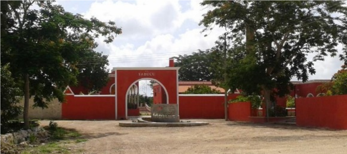
Fig. 14 Predio Yabucu como sitio de aprovechamiento no extractivo para el turismo de naturaleza.

Fig. 13 Mantenimiento de entradas principales y vías de acceso al predio, para fortalecer el atractivo turístico del predio con lo que se espera generar interés por el turismo de naturaleza.