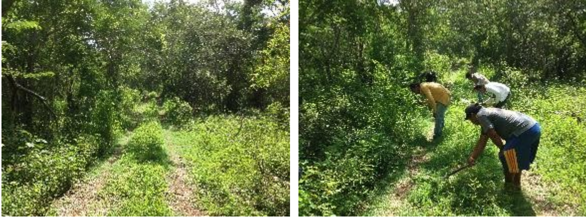
Fig. 11 – 12 camino de movilización interna dentro de la UMA, nótese las actividades de mantenimiento para mantener el acceso en condiciones ideales.