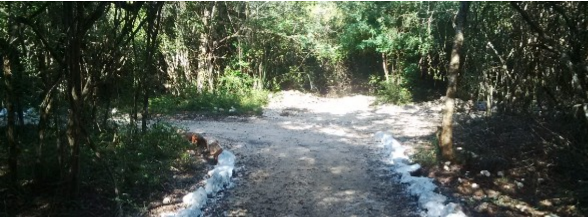
Fig. 7 Intersecciones de los senderos como punto de encuentro para continuar los recorridos.

Se continuaron también con las actividades de brecheo para la realización de estudios, se dieron mantenimiento a las brechas guarda fuego, caminos y brechas preexistentes dentro del predio, todo lo anterior con la finalidad de apegarse al plan de manejo indicado para el mantenimiento del hábitat de la ornitofauna de interés.