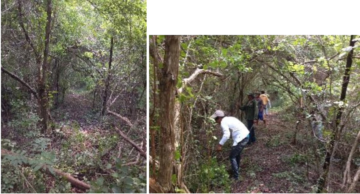
Fig. 8 – 9 Brecha de muestreo preexistente y las acciones de mantenimiento de la misma.