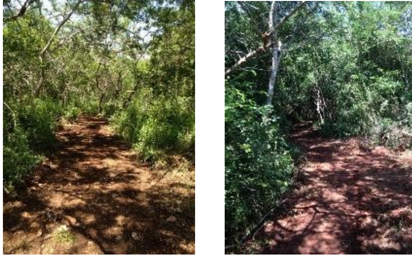
Fig. 3 – 4 avance de los senderos al primer informe.