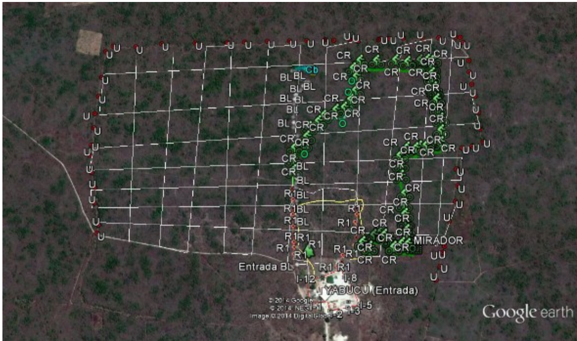
Fig. 2 Imagen del predio Yabucu donde se muestra la totalidad de avances realizados, tanto de brechero como de la elaboración de senderos.

Dentro de las actividades planteadas para el primer informe se estableció la construcción de 2000m de senderos interpretativos con los cuales se cumplió con un avance del 60% al presentar el primer informe, en el presente reporte se evidencia la totalidad de la elaboración de dichos senderos con lo que se cumple la generación de empleos derivados de la conservación del medio ambiente.